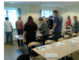
Engagerede kursister - morgendagens "Kompetente Borgerrådgivere"

Børne – og Ungdomspædagogernes Landsforbund BUPL – tilbød i februar måned alle 135 medarbejdere på deres Forbundskontor kompetenceafklaringstest og efterfølgende at komme på kursus, hvis testen viste, at der var grundlæggende it-kompetencer, der med fordel kunne forbedres. Det efterfølgende kursustilbud leveres af DANSK IT's akkrediterede TestCenter 4D Konsulenterne. Projektet løber ind i det nye foreningsår.