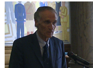
Bertel Haarder (daværende indenrigs- og sundhedsminister) talte på høringen om kommunale it-udbudsregler d. 25. august 2011.

Læs artiklen "IT-udbud er for dyre og skader offentlig innovation"